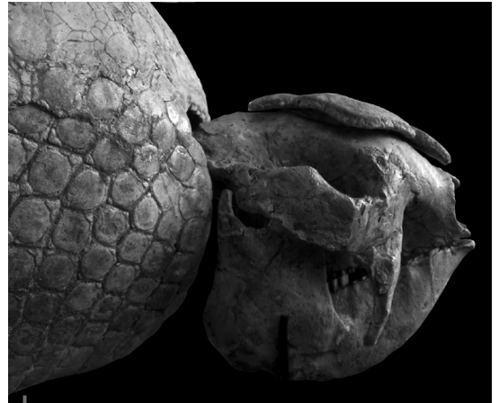
Figura 2 – Gliptodonte Hoplophorinae (INC CUS 6) descubierto en los afloramientos de la Formación Casablanca, localidad de Alto Pichigua y actualmente en exhibición en el Municipio de ese distrito Longitud del cráneo: ~20 cm

El proyecto «Primera fauna nativa del Mio-Plioceno del Perú (Espinar, Cusco): un vistazo a la historia evolutiva del ecosistema altiplánico de Perú y Bolivia» estudiará los fósiles de vertebrados de la provincia de Espinar con el propósito de conocer las últimas comunidades endémicas de mamíferos previas al arribo de la fauna inmigrante de origen holártico, como consecuencia de la instauración del istmo de Panamá. En general, es una época conocida parcialmente en Sudamérica y documentada por primera vez en el territorio peruano. El extraordinario estado de conservación de los fósiles —como es el caso del espécimen de Alto Pichigua (fig. 2)— permite acceder a detalles de la anatomía sistemática y funcional de algunos animales antes solo identificados a través de restos fragmentarios. Por otro lado, en escasos lugares del mundo existe la posibilidad de registrar la fauna de dos o más momentos geológicos próximos en un área geográfica